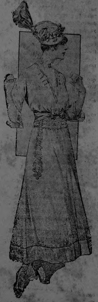
VESTIDO DE VERANO

El tafetán blanco ha sido remplazado por las muselinas y otras telas ligeras. Es de una confección sencilla, distinguiéndose mucho por su belleza. La blusa está cortada por una larga V al frente y a la espalda y está adornada de ojales y botones. La camisola es de pura batista.