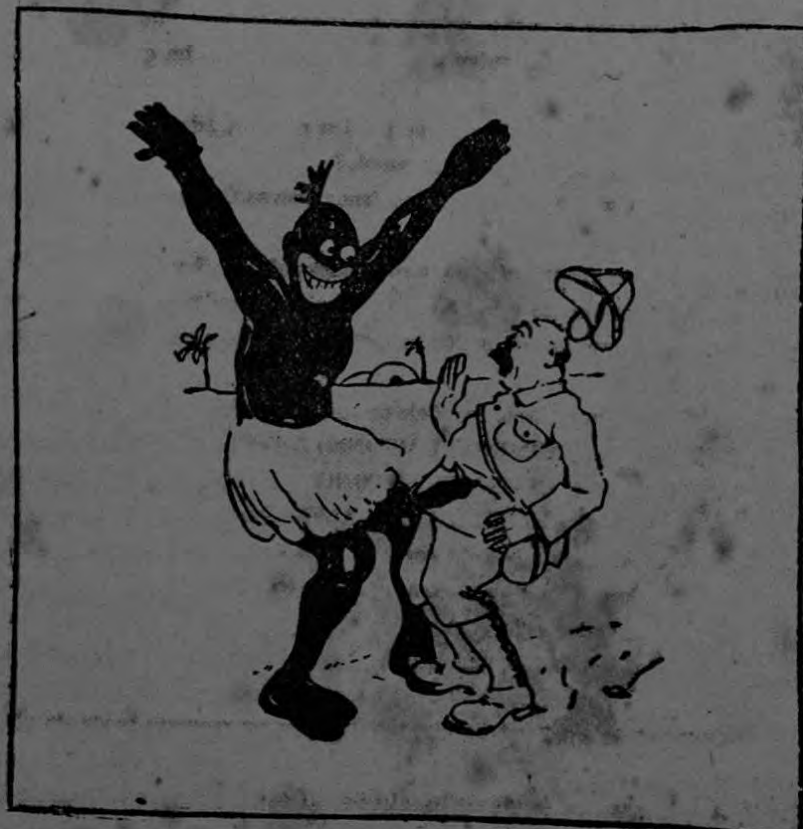
EN EL AFRICA CENTRAL

El saludar con gracia es un verdadero arte. Nada causa peor efecto que ver a una persona aturdida en un salón, sin saber hacia qué lado dirigirse. La naturalidad en los movimientos es señal de gran distinción.