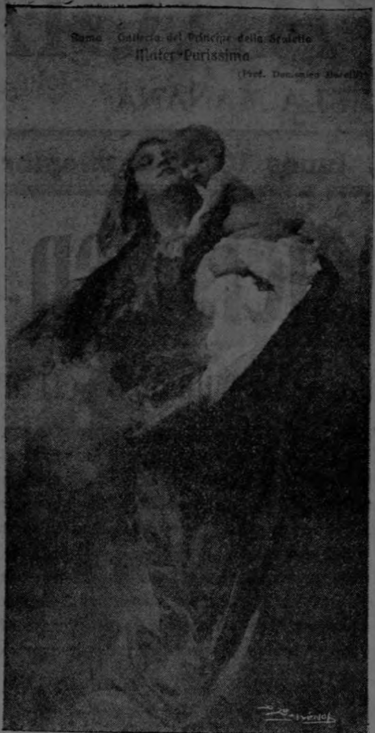
MATER PURISSIMA Famoso cuadro de Domenico Morelli.